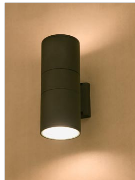
3404 FOG II kinkiet ↓ 27 cm → 17 cm 2 x E27 max 60W IP 44