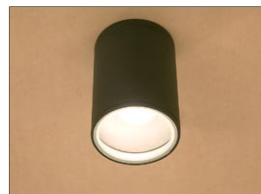
3403 FOG I plafon ↓ 16 cm ∅ 11 cm 1 x E27 max 60W IP 44