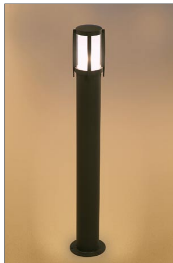
3396 SIROCCO I stojąca ↓ 90 cm ∅ 14,5 cm 1 x E27 max 60W IP 44