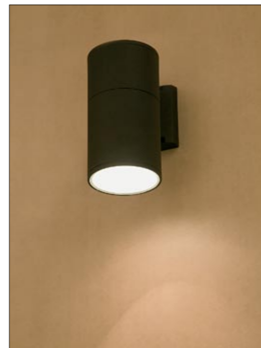
3402 FOG I kinkiet ↓ 20 cm → 17 cm 1 x E27 max 60W IP 44