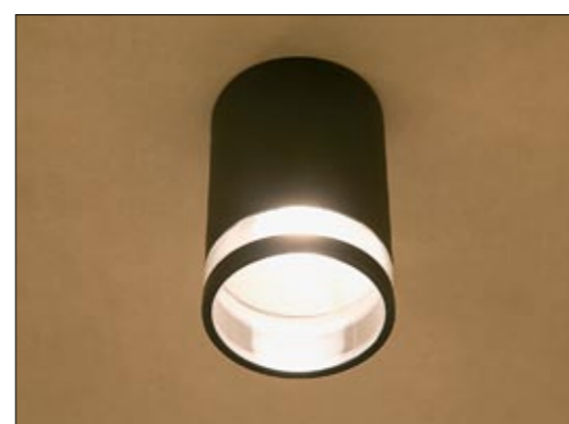
3406 ROCK I plafon ↓ 16,5 cm ∅ 11 cm 1 x E27 max 60W IP 44