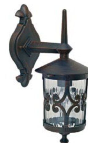
3397 FEN I kinkiet ↓ 38 cm ↔ 23 cm 1 x E27 max 60W IP 44