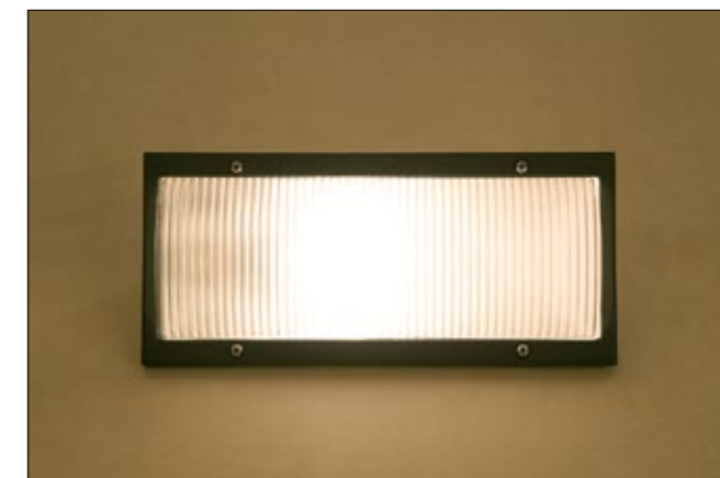
3410 STONE l kinkiet ↑ 12 cm ↔ 27 cm 1 x E27 max 60W IP 44

aluminium, PC | aluminium, PC | алюминий, PC