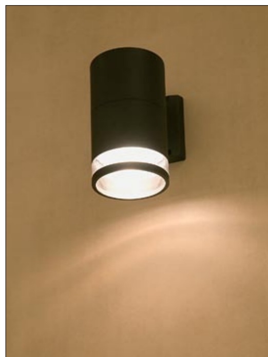
3405 ROCK I kinkiet ↓ 18,7 cm → 17 cm 1 x E27 max 60W IP 44