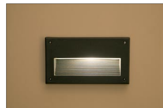
3412 BASALT l kinkiet ↑ 12,5 cm ↔ 22,5 cm 1 x E14 max 60W IP 44

aluminium, szkło | aluminium, glass | алюминий, стекло