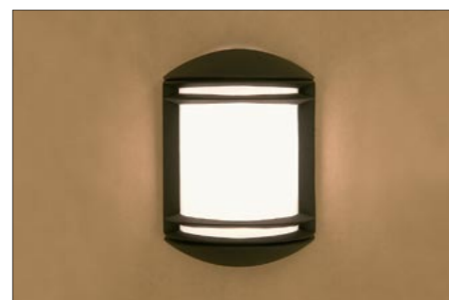
3411 QUARTZ l kinkiet ↑ 26 cm ↔ 18,5 cm 1 x E27 max 60W IP 44

aluminium, PC | aluminium, PC | алюминий, PC