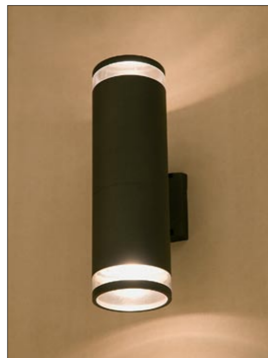
3407 ROCK II kinkiet ↓ 35 cm → 17 cm 2 x E27 max 60W IP 44